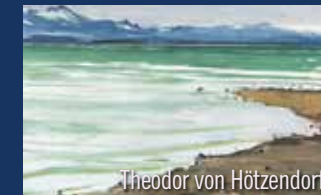
Theodor von Hötzendorff